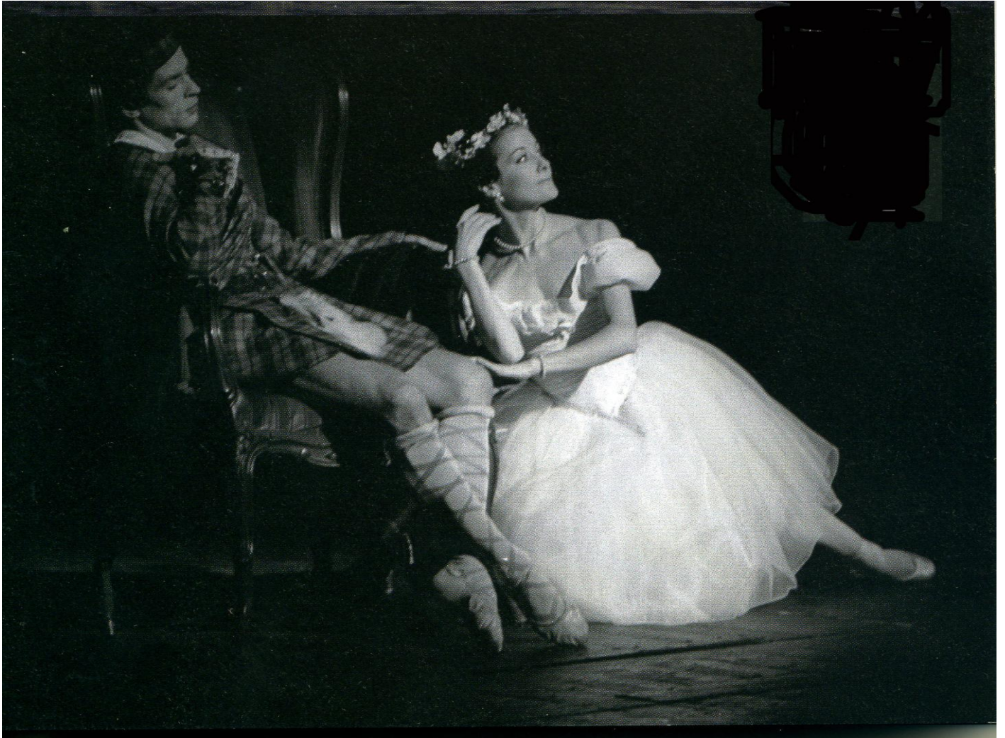
La sylphide (reprise du ballet créé en 1842)