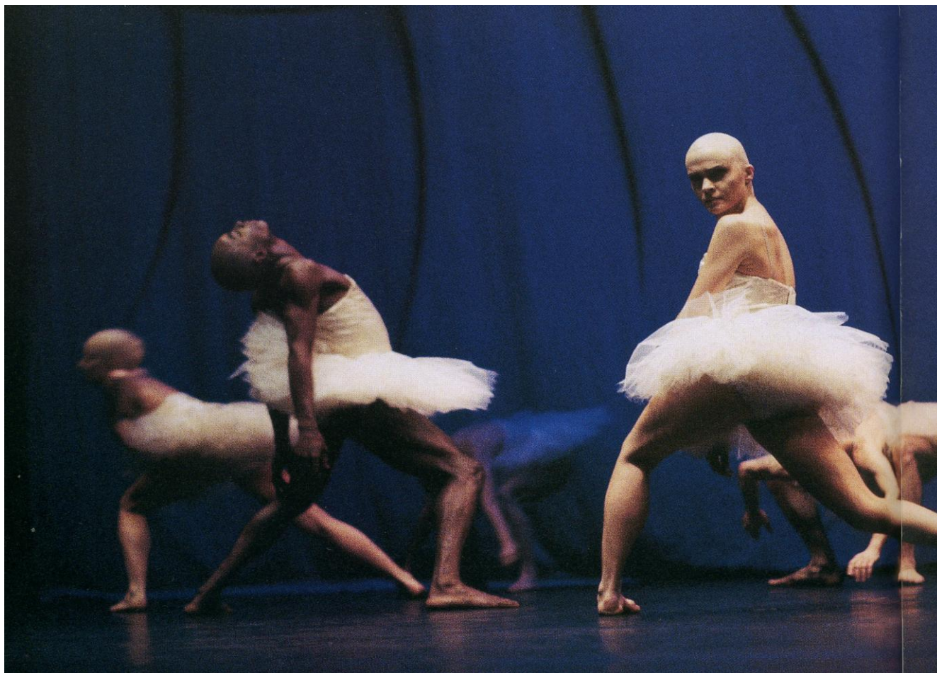
Svansjön , (Le Lac des Cygnes) De Mats Ek, créé en 1987